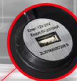
PUERTO DE CARGA USB