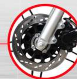
FRENO DELANTERO DE DISCO