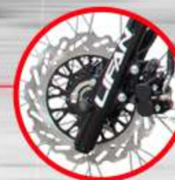
FRENO DELANTERO DE DISCO