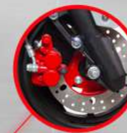
FRENO DELANTERO DE DISCO