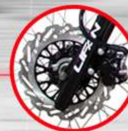
FRENO DELANTERO DE DISCO