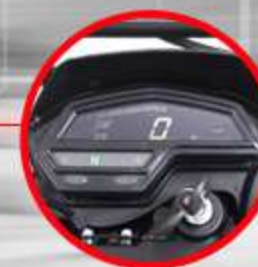
TABLERO 100% DIGITAL