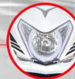
GRAN FARO E ILUMINACIÓN LED