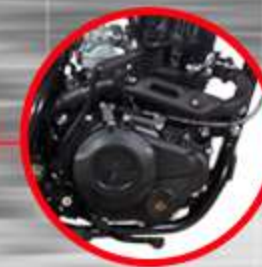
MOTOR A CADENILLA