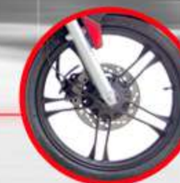
AROS DE ALEACIÓN